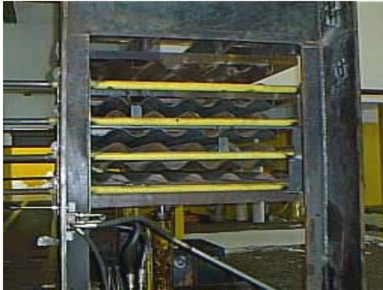
Figura 4. Prensa a frio para formatação das telhas a partir de placas

A produção de placas segue o mesmo processo da fabricação de telhas, no entanto, as placas, ainda quentes, são introduzidas em um processo de prensagem a frio com formas onduladas, em que o material adquire a geometria de telhas ao resfriar. O tempo de resfriamento é da ordem de 5 a 10 minutos, dependendo-se da espessura do insumo produzido. A figura abaixo demonstra este tipo de equipamento.