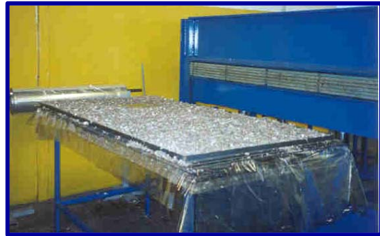
Figuras 2 e 3. Prensa e formas usadas para fabricação de placas e telhas.

Após fusão do polietileno, as placas passam por processo de resfriamento, para cura e endurecimento das camadas plásticas. As espessuras das placas podem variar de 4 a 50mm, dependendo da quantidade de material alimentado e da pressão aplicada.